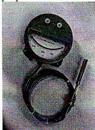
дистанционный настенное исполнение