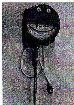
местный радиальное исполнение